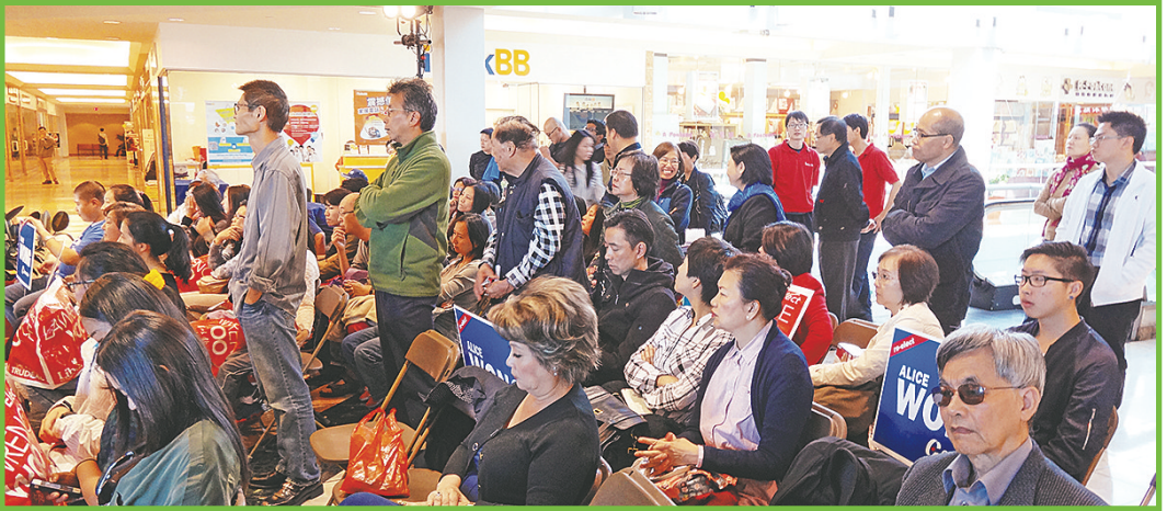
市民排隊踴躍提問。

前來參加辯論會的市民絕大多數爲華裔，因此華裔關注的大麻議題也成爲辯論焦點。在市民提問環節上，半數提問市民的問題皆與大麻有或毒品有關。另外關於安樂死、養老金、政綱是否有中文版、移民政策改進、財政管理、中年人再就業等議題，也有市民提出，但大多是針對保守黨及自由黨提問。