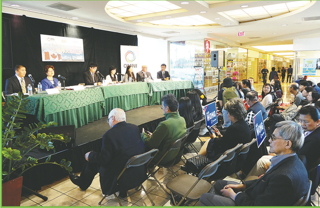
大批市民出席論壇。

【明報專訊】由《明報》、華僑之聲電台、OMNI電視台聯合舉辦的聯邦大選論壇第二場，昨日在列治文八佰伴中心舉行，吸引逾百市民參加。聯邦四大政黨巧合地同時派出列治文中選區（Richmond Centre）的候選人出席，辯論焦點更落在華裔最關注的大麻合法化議題上。