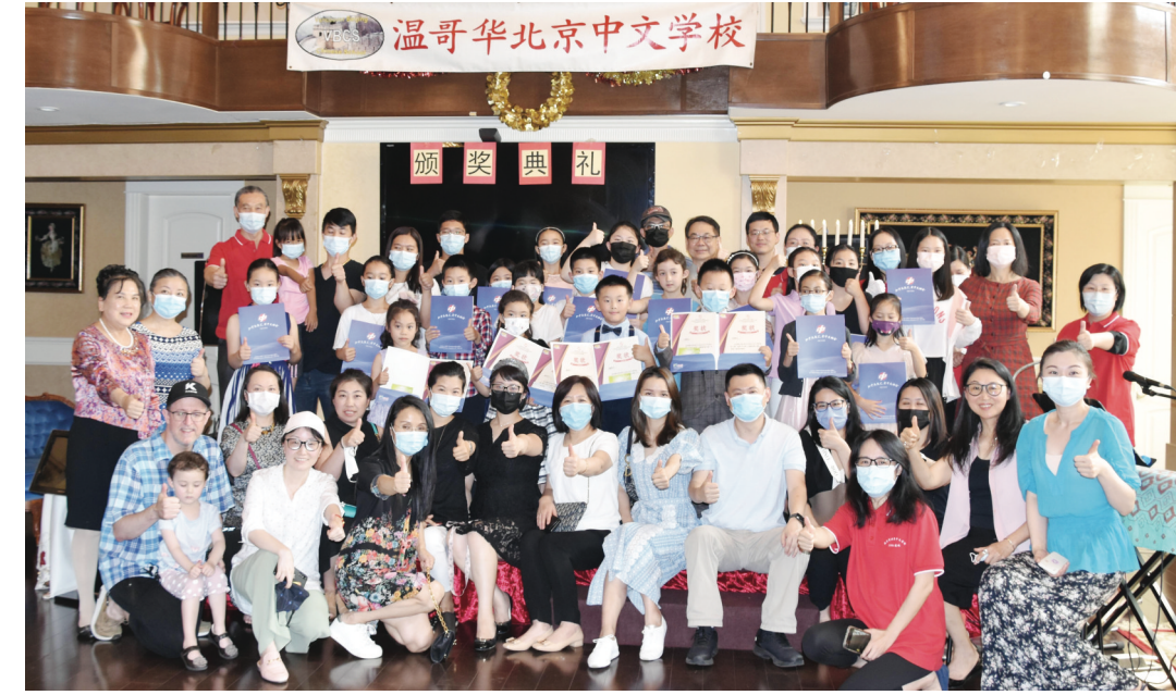
溫哥華北京中文學校8月1日為參加第二屆《青少年網絡詩歌朗誦大賽》的同學舉行了線下頒獎典禮。