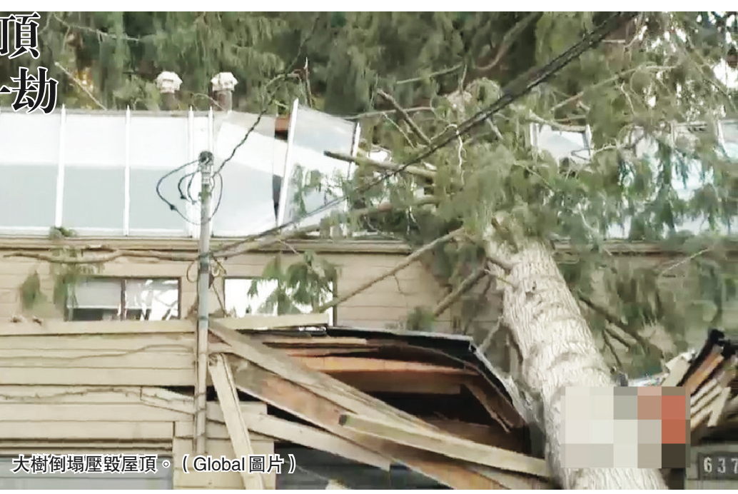
大樹倒塌壓毀屋頂。

據悉女戶主已聘請維修人員為房屋進行檢驗，包括檢查屋內結構是否安全，會否影響旁邊的相連單位。有鄰居表示，前晚風勢十分強勁，不但有多處樹，電力供應也受到影響。