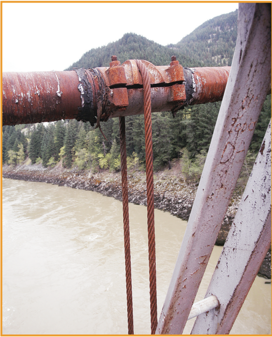
▲橋樑的金屬部件鏽蝕嚴重。

她希望舊阿力山德橋得以保存，認為該橋兼具旅遊及教育價值。她說，這座舊橋應該開發為一個旅遊景點，並進行整修，確保橋樑安全，可以容納維修設備、應急車輛及大量行人通過。