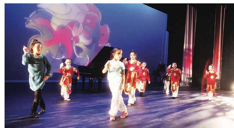
比賽前小朋友們在緊張排練。

據大會介紹，今年是「中國少兒小金鐘音樂大賽」首次走出國門，並在加拿大舉辦，其宗旨是讓本地愛好音樂的小朋友有機會通過這比賽完成自己的音樂夢。