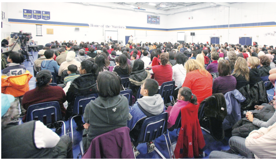
▲約 700 民眾參加昨日的首場諮詢會。 ▶現場民眾亦舉起抗議關校的標語。

針對於昨日卑詩教育廳長換人，溫哥華教育局主席巴克斯 (Patti Baccus) 希望這是個正面、積極的改變，能讓省府和教育局間的溝通更加有效。她說，本週會去信新教育廳長卜佐治 (George Abbott)，要求他能盡快了解教育面臨的困境，共同商討對策，一起解決財政短缺而導致的殺校問題。