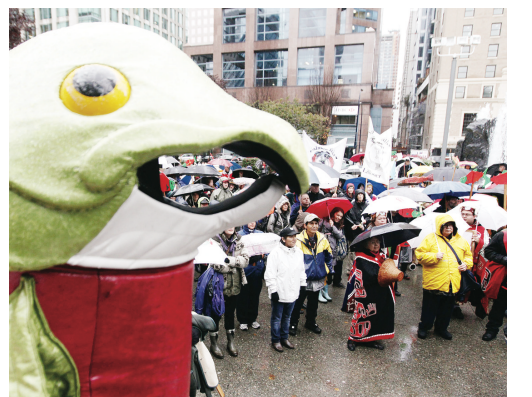
研訊昨日展開之際，身穿三文魚裝扮的女子和一些民眾在溫哥華示威。