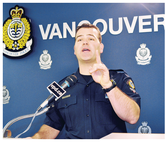
意路面和小心駕駛, 行人也應該遵守交通規則, 在行人設施橫過馬路, 以免發生交通意外。

他說, 近日天色昏暗, 又經常下雨, 容易發生交通意外, 警方呼籲司機遵守行車速度, 留意路面和小心駕駛, 行人也應該遵守交通規則, 在行人設施橫過馬路, 以免發生交通意外。