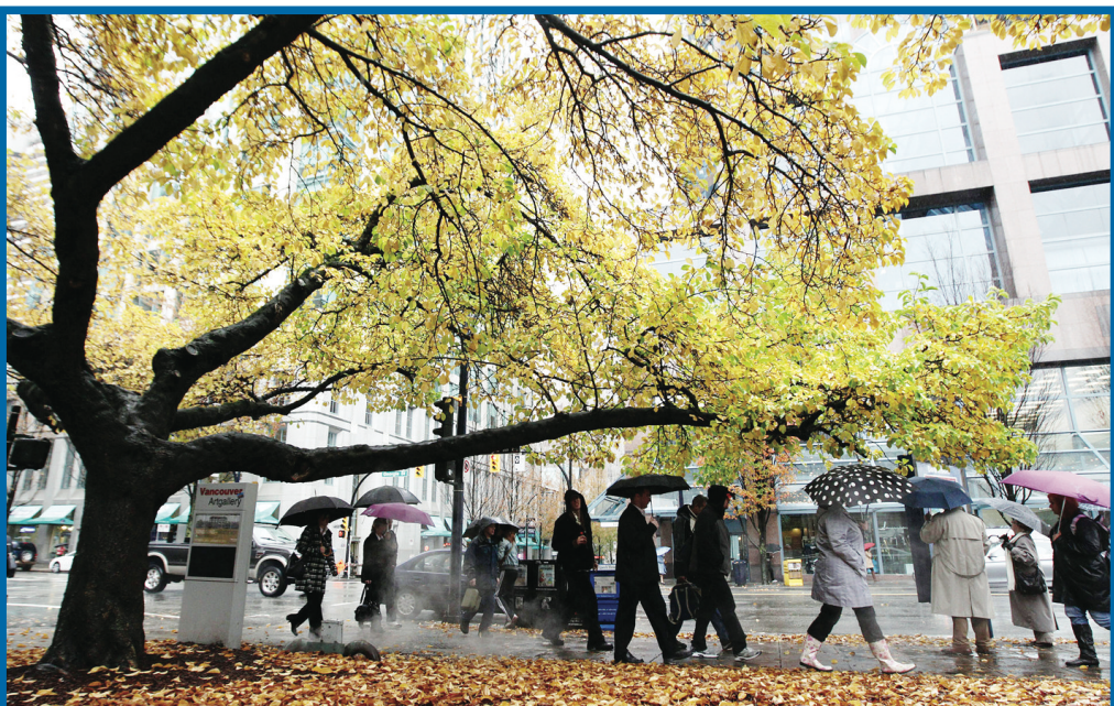
溫哥華行人以雨傘遮雨，腳下滿地落葉。

凡 16 歲或以上在職或待職人士均可報讀。 日期：11 月 5 日 (星期五)，11 月 6 日 (星期六) 時間：上午 8 時半至下午 4 時半 (一天課程) 查詢或報名，請電：604-321-7242。