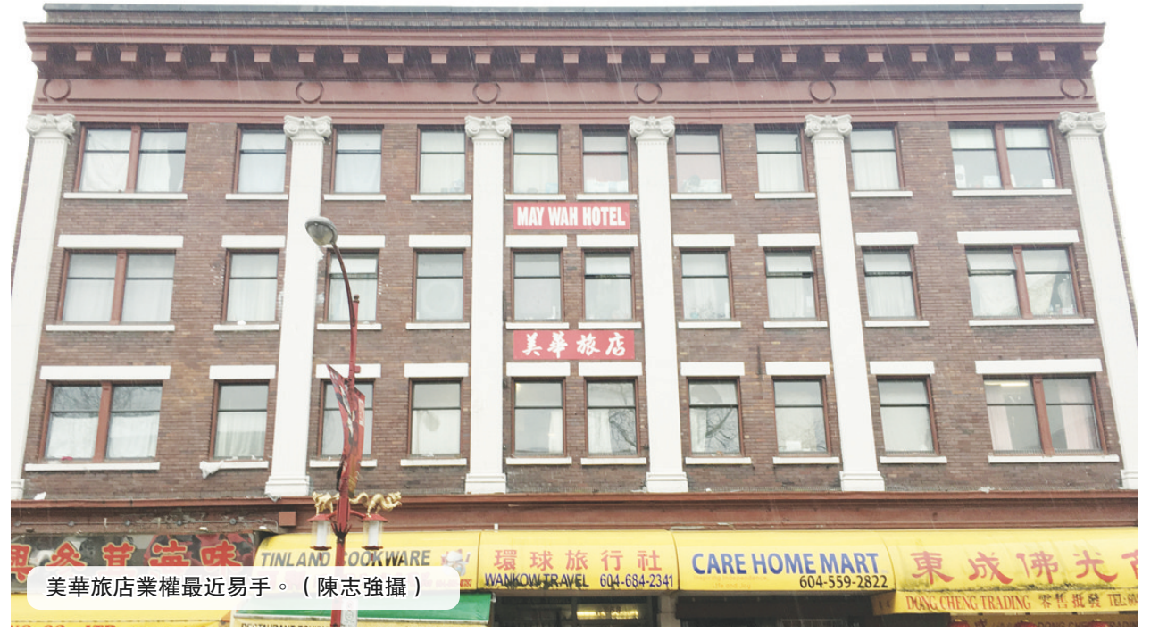
美華旅店業權最近易手。

消息人士說，基金會這次成功購入美華旅店，對於華埠傳統特色的保育，也算是一項重大勝利。消息人士指，基金會並反對華埠發展，但希望華埠在發展的同時，居住在其中的社群以及華埠傳統的文化特色不會遭到排斥。