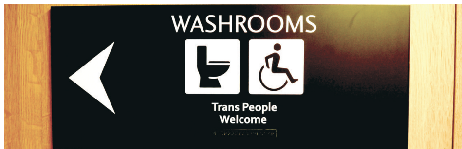
溫市市府在市府大樓內更新廁所標誌，表示「歡迎變性人士」。