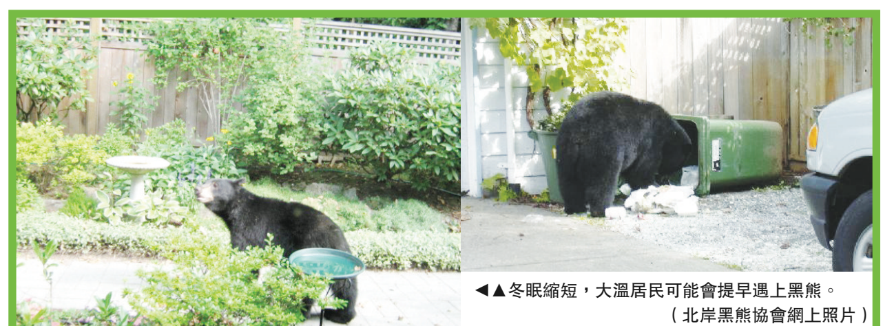
冬眠縮短，大溫居民可能會提早遇上黑熊。

根據市府資料，公廁標誌的更新屬市府一項名為「支持變性者權利，建立包容性溫哥華」的計劃。該計劃於去年7月獲市府批准，包括一系列建議性措施。目前一組市府職員團隊正敦促該項計劃的實施。