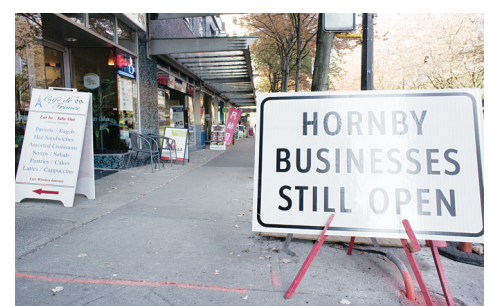
商家痛批「漢比街商家仍然開門營業」告示牌對生意毫無幫助。