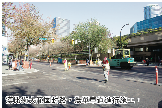
漢比街大範圍封路，為單車道進行施工。

【明報專訊】溫市中心漢比街 (Hornby St.) 單車道工程昨日進入第2日，大規模封路施工引發市中心幾乎交通癱瘓，路人也因此遠離漢比街。施工造成人潮銳減、交通混亂、空氣污染等情況，令漢比街商戶「火滾」，痛批政客踐踏民意，所謂「徵詢民意」只是「循例作秀，卻浪費納稅人的金錢替自己拉選票。