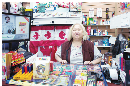
李女士指單車道工程嚴重影響生意。

門消費，而且因為施工封路，許多電台在空中呼籲市民「避免使用漢比街」，讓人流減少的情況雪上加霜。