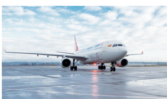
首都航空杭州-青島-溫哥華航線首班飛機抵達溫哥華。

根據背景資料，北京首都航空選擇溫哥華國際機場作為該公司在北美的第一個試點。北京首都航空也是第六家飛溫哥華國際機場的中國航企，在北美洲和歐洲其他的機場，最多只有四家中國航企執飛。