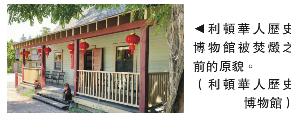
▲利頓華人歷史博物館被焚燬之前的原貌。(利頓華人歷史博物館)