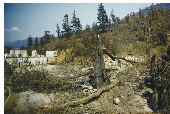
▲利頓華人歷史博物館焚燬後的近距離照片。

國際足協於 2018 年 6 月公布加拿大、美國和墨西哥成功取得 2026 年世界盃的聯合主辦權, 而該屆賽事的參加隊伍會由 32 隊增至 48 隊, 一共 80 場比賽, 美國的城市舉行 60 場, 包括八強後所有賽事, 而加拿大和墨西哥各舉辦 10 場。