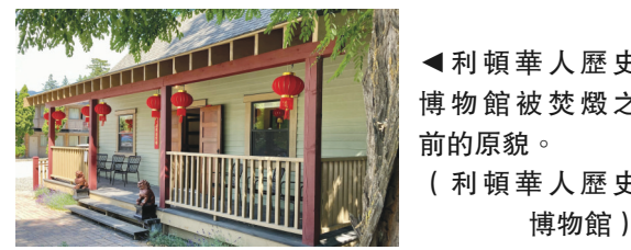
▲利頓華人歷史博物館被焚燬之前的原貌。(利頓華人歷史博物館)