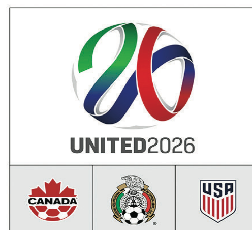
BIDDING NATIONS CANADA • MEXICO • UNITED STATES 聯合申辦委員會申辦 2026 年世界盃的標誌。

他續說：「但現在，來到 2021 年，我們處於一個完全不同的主辦城市。我們從全球大流行中走出來，我們的旅遊業在過去 16 個月所受到的衝擊，可能比其他任何行業都大。邀請世界於 2026 年來到溫哥華的前景突然有了全新的意義——不只為了足球充滿熱情民眾，也為了一些人想有機會去重新認識有卑詩省，尤其溫哥華壯麗景色的世界。」