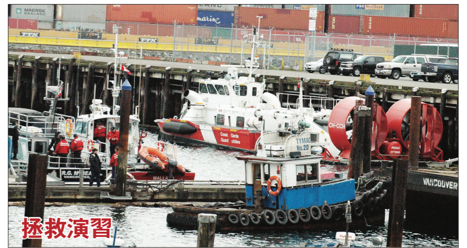
溫哥華市警、水警、港口局、消防處，聯同加拿大海岸防衛隊和飛行服務隊，昨日在緬街(Main St.)北端的Crab Park公園對開海面，進行一場模擬小型飛機墜海緊急事故演習。上圖為海岸防衛隊隨時候命出動。下圖為消防車及多輛警車停在貨櫃碼頭戒備。

生，於二路橋對開的河堤草地，植下12株由日本總領館捐出的櫻花樹。大塚聖一表示，列市除了是不少日裔加人聚居地點之外，與和歌山縣於35年前成為姊妹城市之後，兩地的友誼對維繫加日兩國關係扮演了重要的角色。