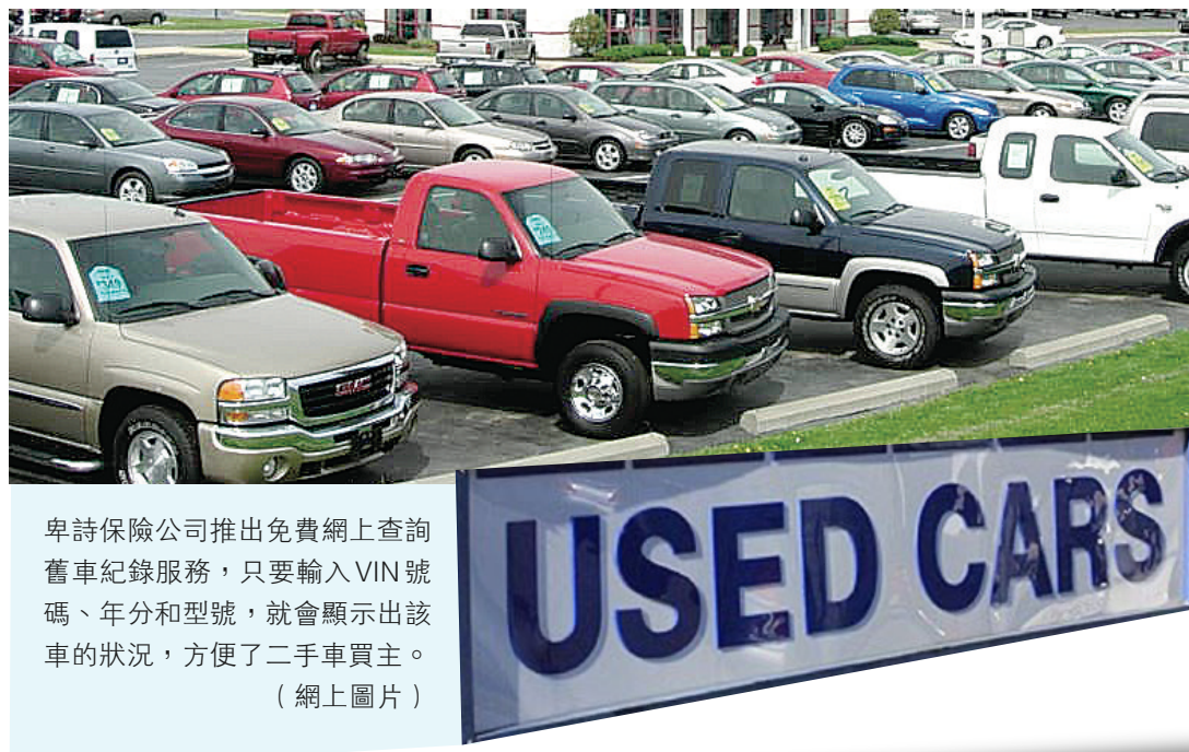
卑詩保險公司推出免費網上查詢舊車紀錄服務，只要輸入VIN號碼、年分和型號，就會顯示出該車的狀況，方便了二手車買主。

【明報專訊】卑詩保險公司(ICBC)昨日推出一項全新的網上免費服務，想要買二手車的省民可以上到卑保的網站，只要輸入該輛舊車的VIN號碼，以及該輛車的年分 and 型號，就可以立刻查出該輛車是否曾經報廢，或是重組或是改裝，讓省民在買車之前多知道一些資訊，以免買到「紀錄不良」的汽車。