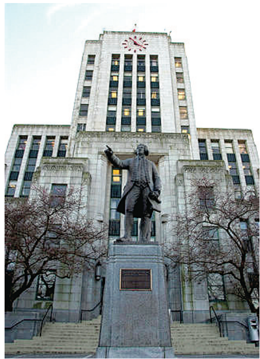
溫哥華市議會將於今日討論多項可負擔房屋計劃，圖為溫哥華市政大廈。