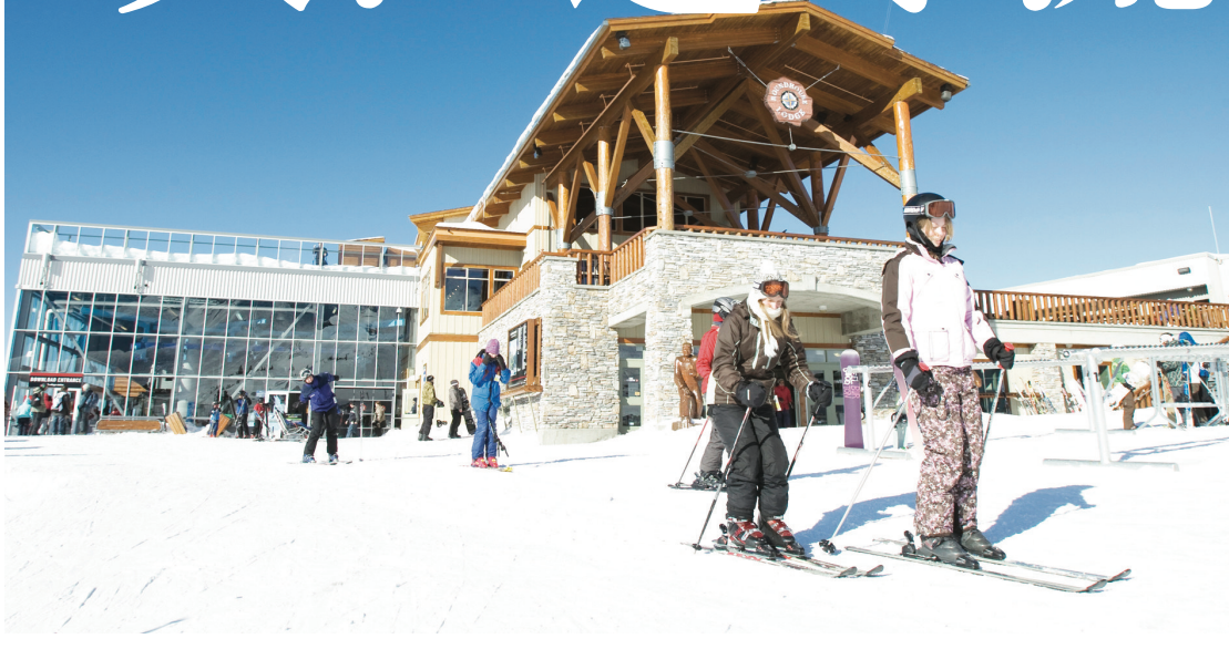
滑雪季於上周剛開始的威士拿今早料有5至10厘米降雪。