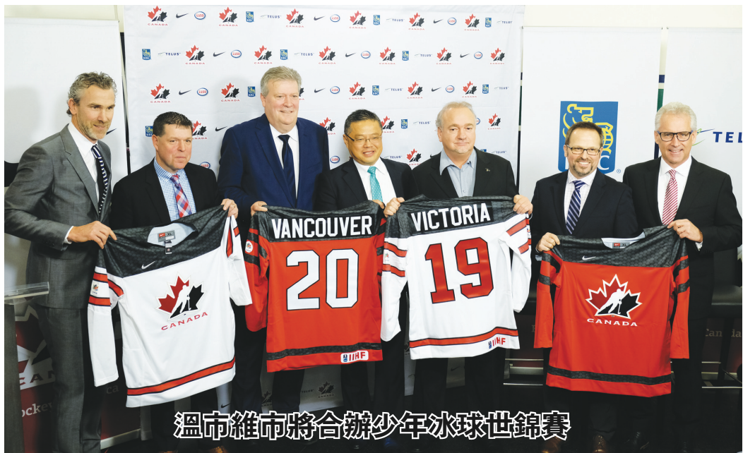
溫市維市將合辦少年冰球世錦賽

女場主在多年前曾經被限制餵養動物，不排除稍後會提出刑事起訴。另外，協會指獲救的狗隻在未來幾星期內，都不會開放給公眾領養。 莫里亞蒂稱，協會正與省府合作，制訂法例監管動物繁殖，避免同類事件再次發生。