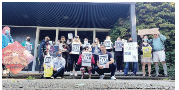
十多名反對撲殺郊狼計劃的民眾在溫哥華公園局總部外集會。

【明報專訊】十多名反對史丹利公園(Stanley Park)撲殺郊狼計劃的民眾，同三(15日)早上聚集於溫哥華公園局(VPB)總部外，「哀悼」這些被人道毀滅的野生動物。