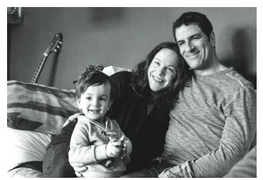
15 個月大男童於託兒房屋發生事故死亡，他的父母現呼籲要改革本省託兒系統。(資料圖片)

他們續指，明白家長害怕和想知道事件怎樣發生，而他們在物色託兒位置時，已檢查所有應查方面，列出條件和問題清單，又簽了文件和獲得保證兒子可獲妥善照顧及安全，但「最