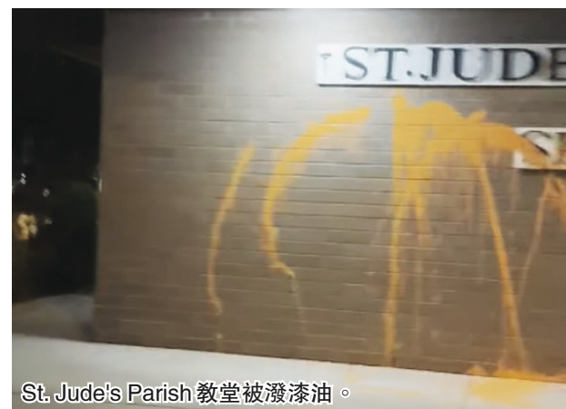
St. Jude's Parish 教堂被潑漆油。

市警續指，周四晚事件並非近期首宗針對無家可歸人士的襲擊案，在不足一個月前，於7月26日凌晨約1時，另一露宿者於耶魯鎮被推跌，他倒地後更遭對方連踢多次，受害人不認識施襲者。7月一案，警方仍在調查中和未有拘捕任何人。艾迪森說：「我們知道露宿者較有居所的人，更常成為罪案中的受害人，警方現盡一齊可能去找到為此案負責的人，將其繩之以法。」