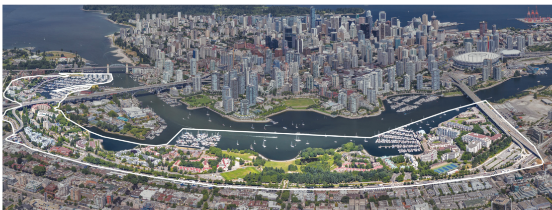
市議會將討論福溪南區的未來概念性規劃。

福溪南區是指, 由甘比街 (Cambie St.) 至布勒街 (Burrard St.) 在福溪南面的河對面地區, 但不包括格蘭維島 (Granville Island) 和「Senakw」, 後者屬原住民部族的部分保留地。