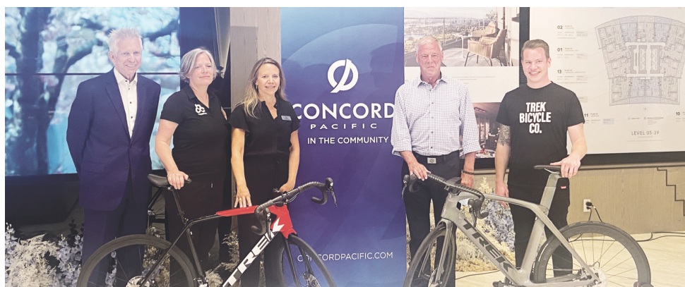
單車節 協平世博宣布本月22日將會舉辦鐵道鎮單車節。

為了慶祝世界最大型的單車綜合社區計劃即將在本那比的Concord Metrotown社區啓動，本月22日將會舉辦Tour de Concord鐵道鎮單車節。