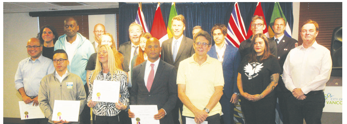
受嘉許的「好市民」與市長羅品信等合照。