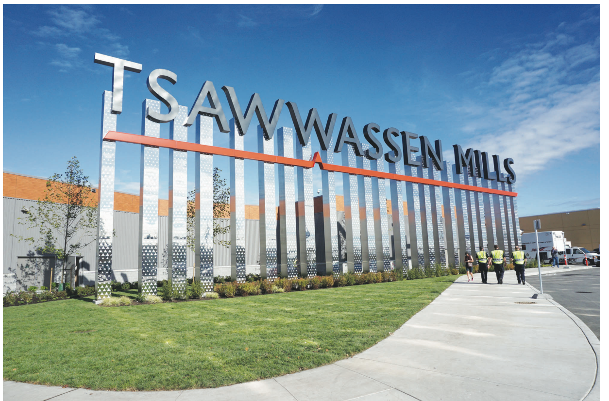
杜華遜大型商場 Tsawwassen Mills 日前開幕，有180間店舖進駐。