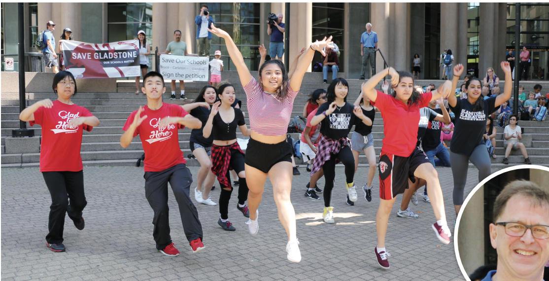
▲學生們跳起青春洋溢的舞蹈，希望獲得市民支持。

【明報專訊】約20名中學生昨日在溫市中心舉行「快閃」及「跳舞」活動，期求當局不會關閉有逾千名學生的 Gladstone 中學。