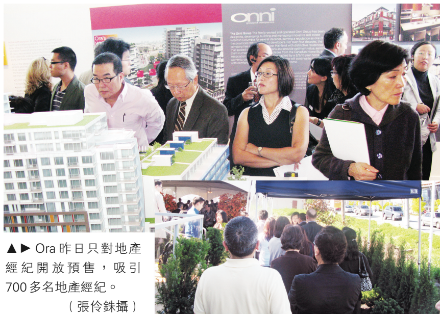
▲▶ Ora昨日只對地產經紀開放預售，吸引700多名地產經紀。