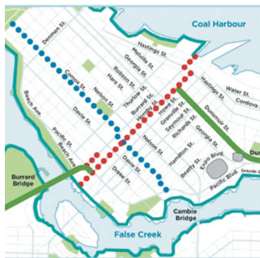
紅點線路為漢比街獨立單車線。

漢比街的商戶及溫市中心商業促進協會對此一直表達強烈反對，協會及商戶們認為，市府完全不尊重他們的意見，之前的徵詢非常簡略，市府對商戶提到例如維持現有單車線的建議，完全充耳不聞。