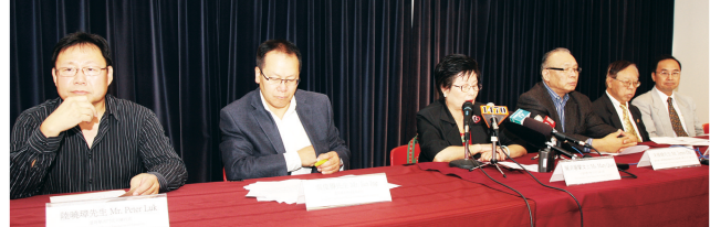
▲近百名社區人士出席反對城市農場記者會。