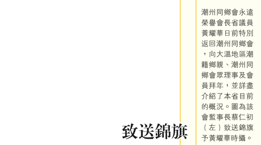
潮州同鄉會永遠榮譽會長省議員黃耀華日前特別返回潮州同鄉會，向大溫地區潮籍鄉親、潮州同鄉會理事及會員拜年，並詳盡介紹了本省目前的概況。圖為該會監事長蔡仁初(左)致送錦旗予黃耀華時攝。

省議員黃耀華則說，從趙松基榮獲女皇金禧紀念勳章這件事來看，就可以說明溫哥華趙氏宗親會在社會上發揮了巨大的作用。黃耀華更代表卑詩省政府向溫哥華趙氏宗親會頒發了獎狀。