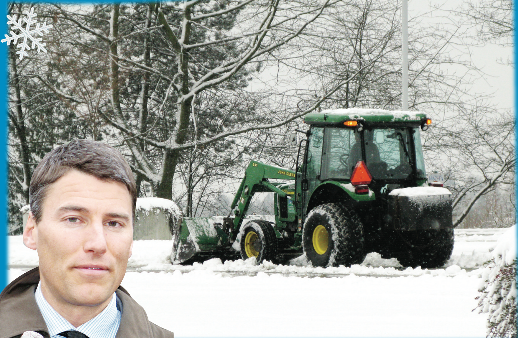
◀市長羅品信往墨西哥度假，曬到一臉古銅色，但剛一返加就要面對溫哥華大雪帶來的問題。

他稱今年的大雪不同尋常，是近50年來最嚴重的一次，市府現有的設備及預算未足以應付如此嚴重的降雪，是否會因此添置設備還要全面考量後才能決定，但他也承認，溫市近5、6年清除積雪費用直線增加，顯示必須採取行動應付氣候變化帶來的影響。目前他最關心的問題是那些被困家中的市民，不排除考慮強制商業業主清除門前積雪。近期大溫將出現強降雨和大風天氣，民衆可幫手清除積雪，以防可能出現的水浸。