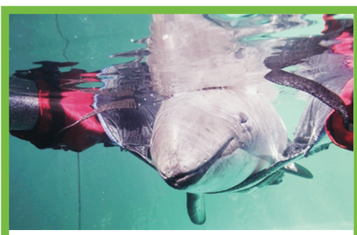
Theo經過71日治療後，於前晚去世。