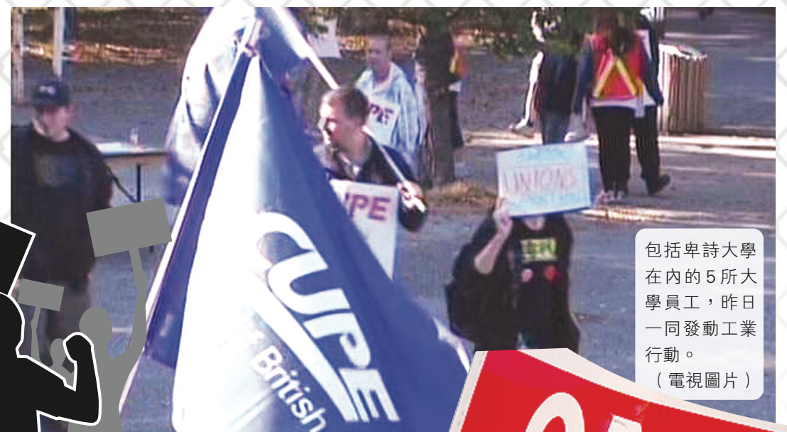
包括卑詩大學在內的5所大學員工，昨日一同發動工業行動。

【明報專訊】卑詩五大知名大學的工會昨日一同發動工業行動，行動成員大部分為教學助理及支援員工，他們各自於校園內設置糾察線包圍建築物，或者按章工作拒絕超時加班，其中北卑詩大學 (UNBC) 更一度在形式上「封鎖」校園達3小時，但實際上沒有阻止其他人出入。