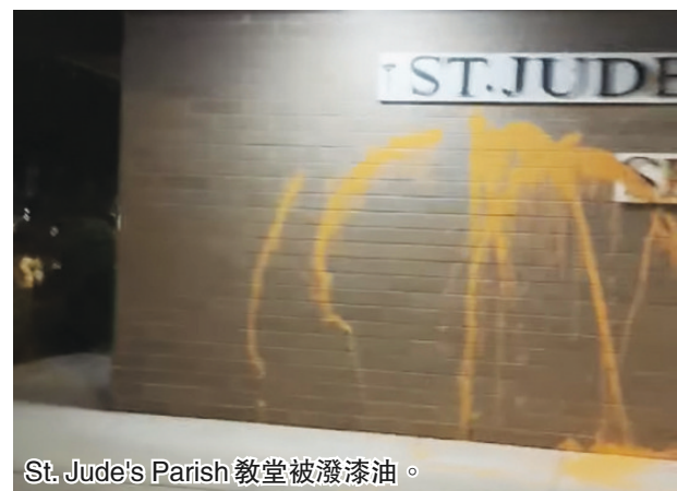
St. Jude's Parish 教堂被潑漆油。