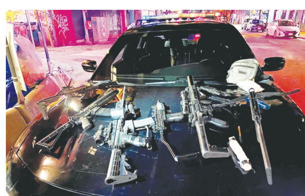
溫市警指周四晚隨機襲擊案後，於附近一大廈發現一批武器和仿制步槍。

This is not an offering for sale. Such offering may be made by Disclosure Statement only. September 2021.