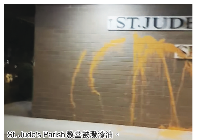
St. Jude's Parish 教堂被潑漆油。