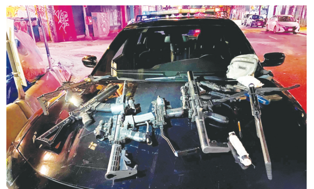
溫市警指周四晚隨機襲擊案後，於附近一大廈發現一批武器和仿制步槍。

This is not an offering for sale. Such offering may be made by Disclosure Statement only. September 2021.