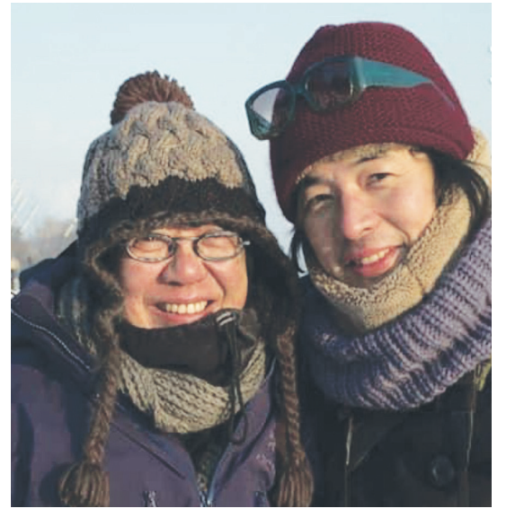
許鞍華（左）與文念中（右）是工作拍檔，也是好友。

電影從2016年開拍，將近4年時間才正式完工。導演文念中通過這部紀錄片，將年過70，精力充沛的香港名導演許鞍華，從幕後帶到幕前，把她對電影，對香港的一片赤誠，細訴觀眾。