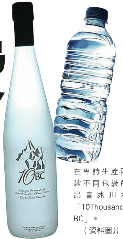
在卑詩生產兩款不同包裝的昂貴冰川水「10Thousand BC」。(資料圖片)

生產「10Thousand BC」瓶裝水的公司，表示已經了解中領館方面的處境，他們正在考慮用其他方法解決問題，因該公司在中國大陸暫時沒有出售該種冰川水，所以正與韓國的分銷商商議，可否先將供應當地的瓶裝冰川水就近運送至中國，但目前還無結果。