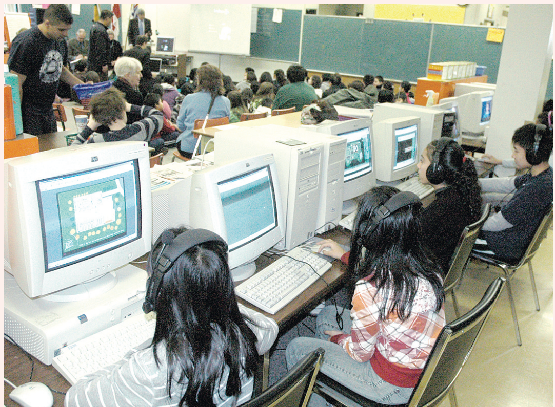
學生示範新遊戲的玩法。

溫哥華教育局先前曾經與LiveWires合作，開發互聯網安全遊戲《失蹤》(Missing)，已經發行12個國家，接觸到500萬名學生。