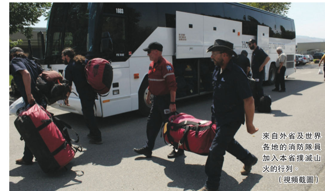
來自外省及世界各地的消防隊員加入本省撲滅山火的行列。(視頻截圖)