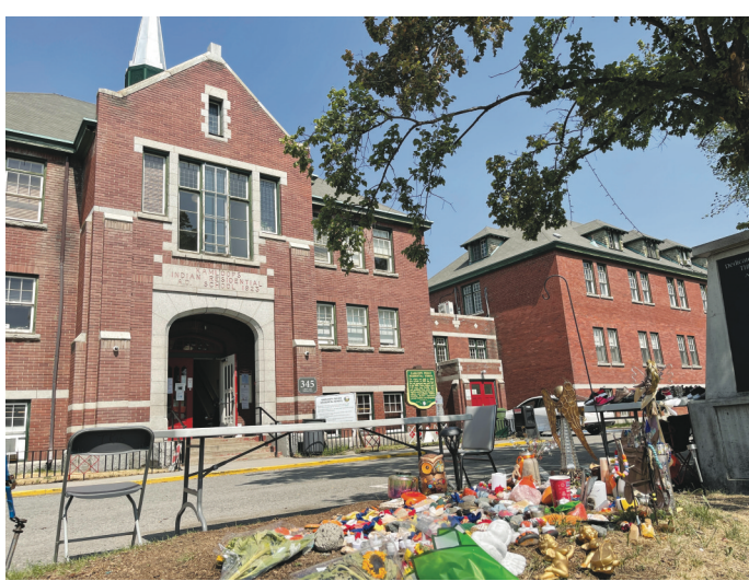
▲「甘露市華人公墓」的兩頭中式石獅。

【明報專訊】錦碌市(Kamloops)原住民寄宿學校舊址發現200多個無名墓葬，可能埋葬了當年就讀的原住民小孩一事，引起廣泛關注。近日，幾個華人組織的代表組團親自走訪錦碌市，希望進一步了解寄宿學校的歷史，以及早期錦碌市華人的生活面貌。幾位社團代表探訪過後表示，可能會組織更多華裔青少年前往參觀，認識歷史。