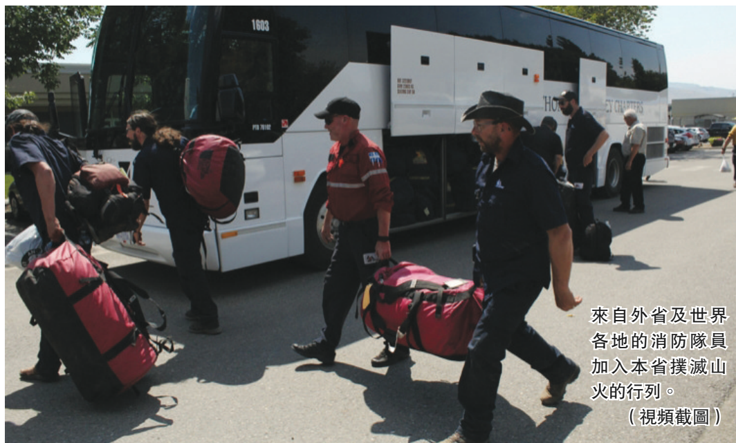
來自外省及世界各地的消防隊員加入本省撲滅山火的行列。(視頻截圖)

CBC報道指出，上月熱浪那一周猝死的人數，較2016年至2020年期間，同一周平均猝死198人，增加了3倍。非沙衛生區熱浪死亡人數，比以往增加6倍。過去5年在熱浪發生的一周，非沙衛生區猝死平均人數只有50人，溫哥華沿岸衛生區則平均有45人。6月29日那天，當內陸小鎮利頓(Lytton)氣溫打破加拿大紀錄時，一天之內本省即有300人猝死。