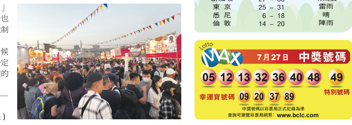
夜市擁擠的畫面在社交媒體上流傳。

據溫哥華沿岸衛生局表示，當局會向活動的主辦方提出有關憂慮，並建議主辦方實施更嚴格的防疫措施，包括限制售票、更明確地控制人流、以及更清晰和嚴格指示到訪者保持社交距離。