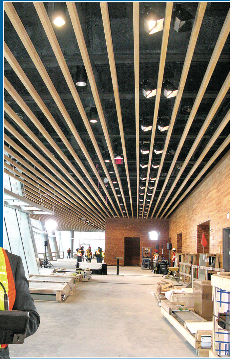
▲新館內部裝修很有藝術感。 ◀貝爾德形容整個溫哥華會展中心新館是「卑詩省出品」。

【明報專訊】溫哥華會展中心擴建工程昨日進入倒數100日，承建公司特地開放讓傳媒參觀。在省府追加預算後，承建公司強調不會出現超支，並承諾會準時完成這座「卑詩出品」的新展覽館。