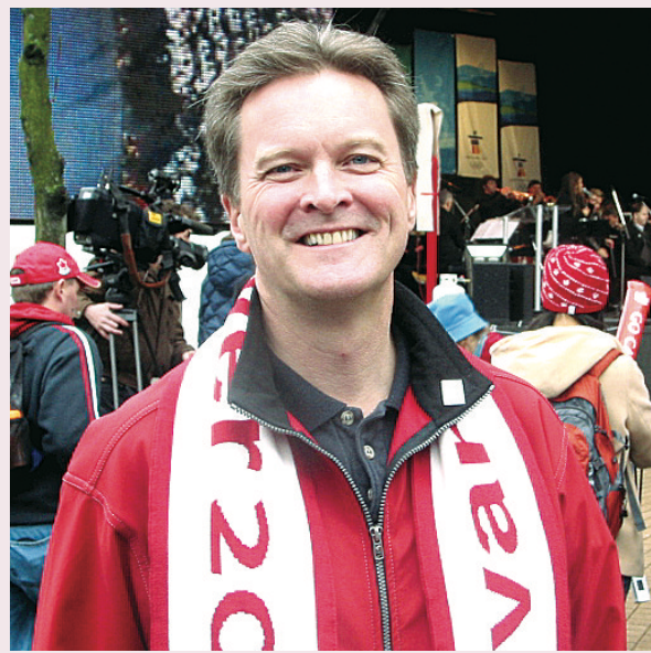
韓仕新指，將冬奧帶來的建設與機會，成為全省社區和商業的遺產，是卑詩省首要目標。

韓仕新強調，卑詩省商貿代表團在北京取得成功，希望將這股氣勢帶回卑詩省迎接2010冬奧。最重要是向世界展示，卑詩省是生活、工作、玩樂及投資的最佳地方。