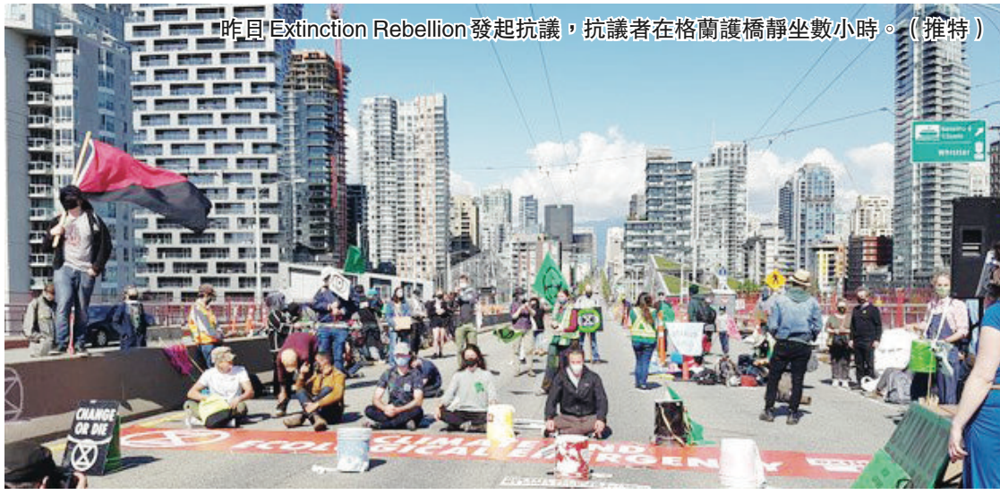
昨日 Extinction Rebellion 發起抗議，抗議者在格蘭護橋靜坐數小時。(推特)

【明報專訊】一群環保人士昨日中午起在溫市重要幹道格蘭護橋(Granville St. Bridge)靜坐，抗議政府對因應氣候變遷無作為，該抗議令經過格蘭護橋的交通完全停擺。