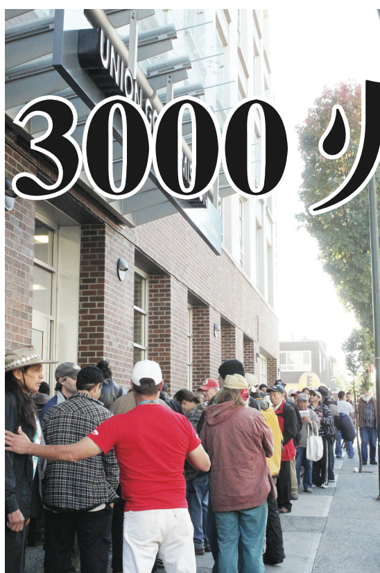
▲圍着教會大樓排隊的人龍長達一個大門口。