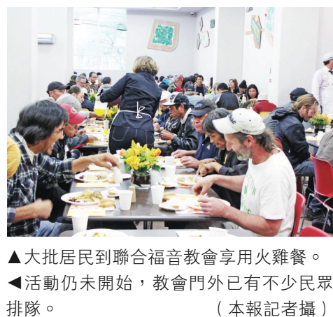
▲大批居民到聯合福音教會享用火雞餐。 ▲活動尚未開始, 教會門外已有不少民眾排隊。