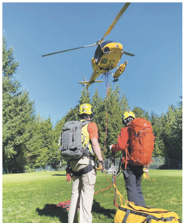
北岸搜救隊本年已收到174通求助電話，創新高。

鑑於本周末料會有大雨，丹克斯呼籲公眾在遠足時應加倍小心，特別在溪流附近。他補充，不小心墮進溪流是非常危險的，降雨亦會增加搜救隊施救難度。他也建議民衆，選擇汽車容易抵達，靠近市區的行山路徑。