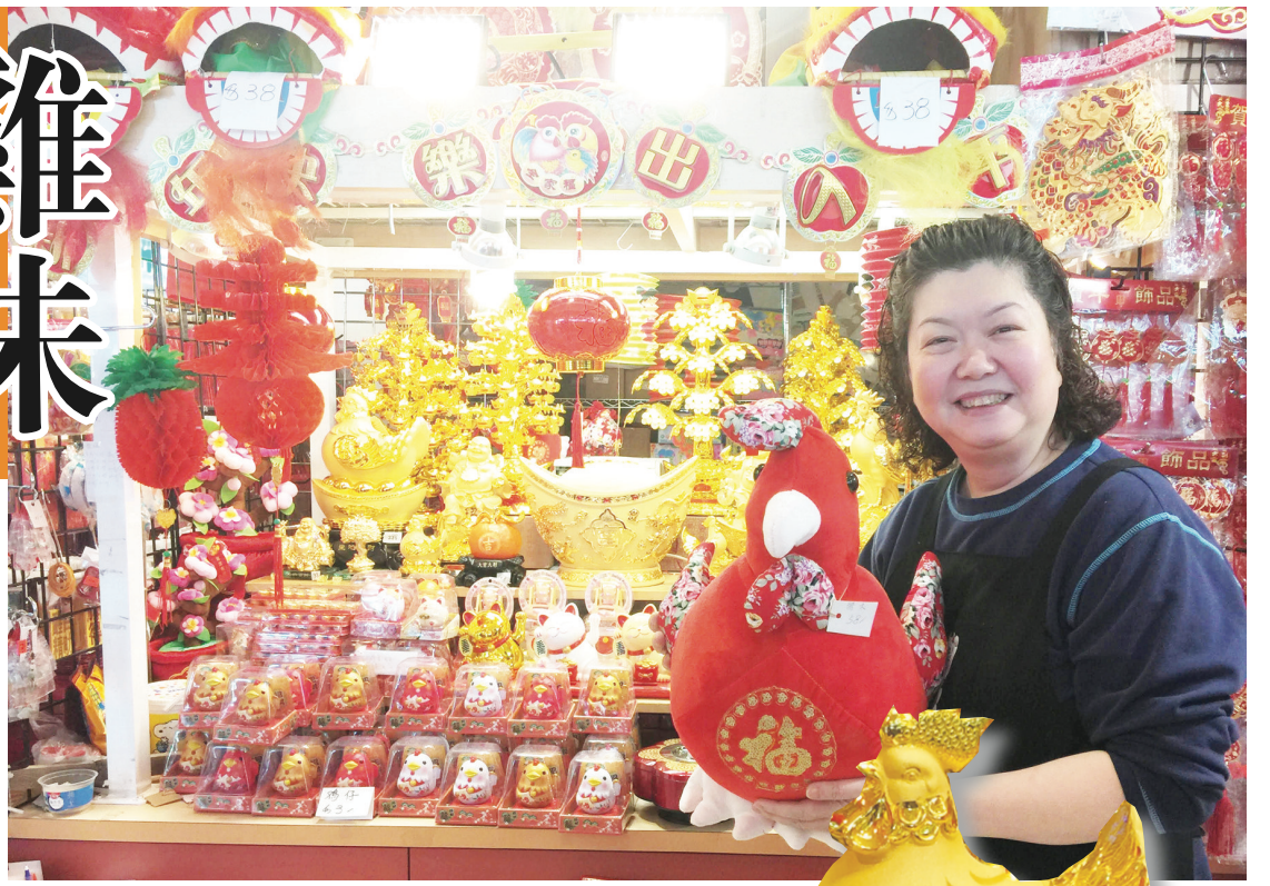
▲梁小姐稱今年雞造型的新年飾品非常豐富。 ▲各種以雞為造型的裝飾品備受歡迎。 ▲關先生及太太每年都要購買利市封給孫輩派利市。

她還指出,現在人們派利市出手闊綽,不少人需要能放百元鈔票的大利市封,而利市封也愈做愈豪華,今年除了增加雞年造型利市封外,還新增絨布做的利市封,看上去更加高檔。