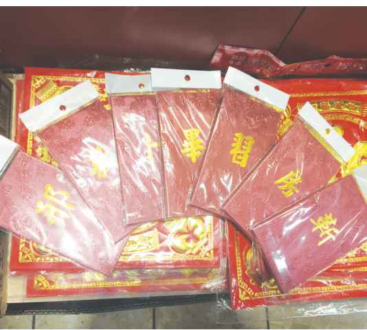
百家姓利市封新添許多來自中國大陸的姓氏。