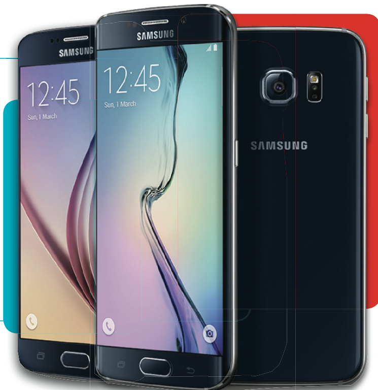
Samsung Galaxy S6™ | Samsung Galaxy S6 Edge™