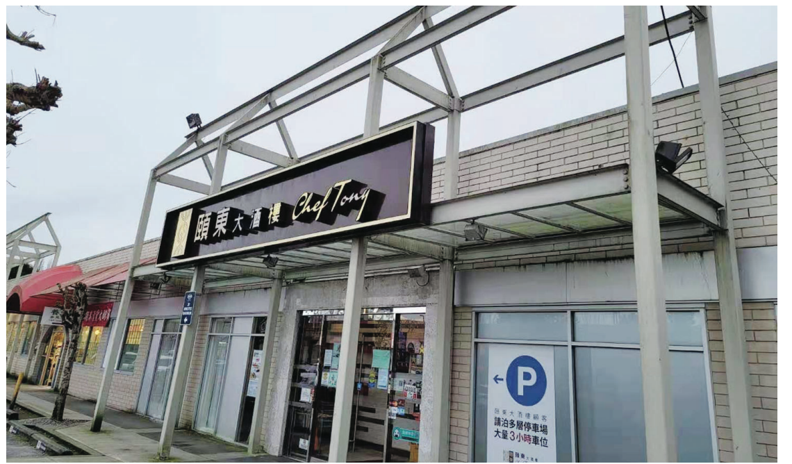
頤東大酒樓為了保護員工安全，已在禁令宣布後不久決定全面暫停營業。

表示，「不可能回到疫情前」，重開之後，為限制人數，餐廳採取隔位入座，就算客滿，人數也只剩之前的四、五成，「不好的時候，一、兩成的情況都有。」