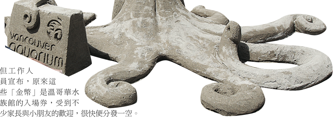
▲水族館特別僱人製作的八爪魚沙雕。

溫哥華水族館將在6月使用新入口及開放5.5萬平方呎的場地，並會在6月19日晚上舉行盛大派對，加以慶祝。