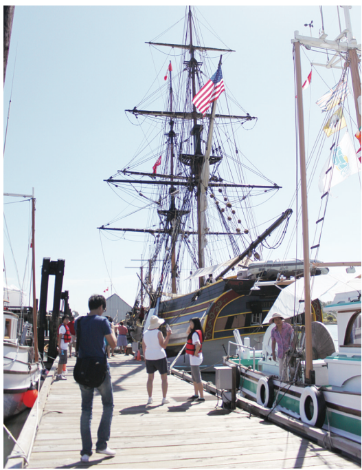
▼群衆可以登上高桅帆船 Lady Washington 參觀。