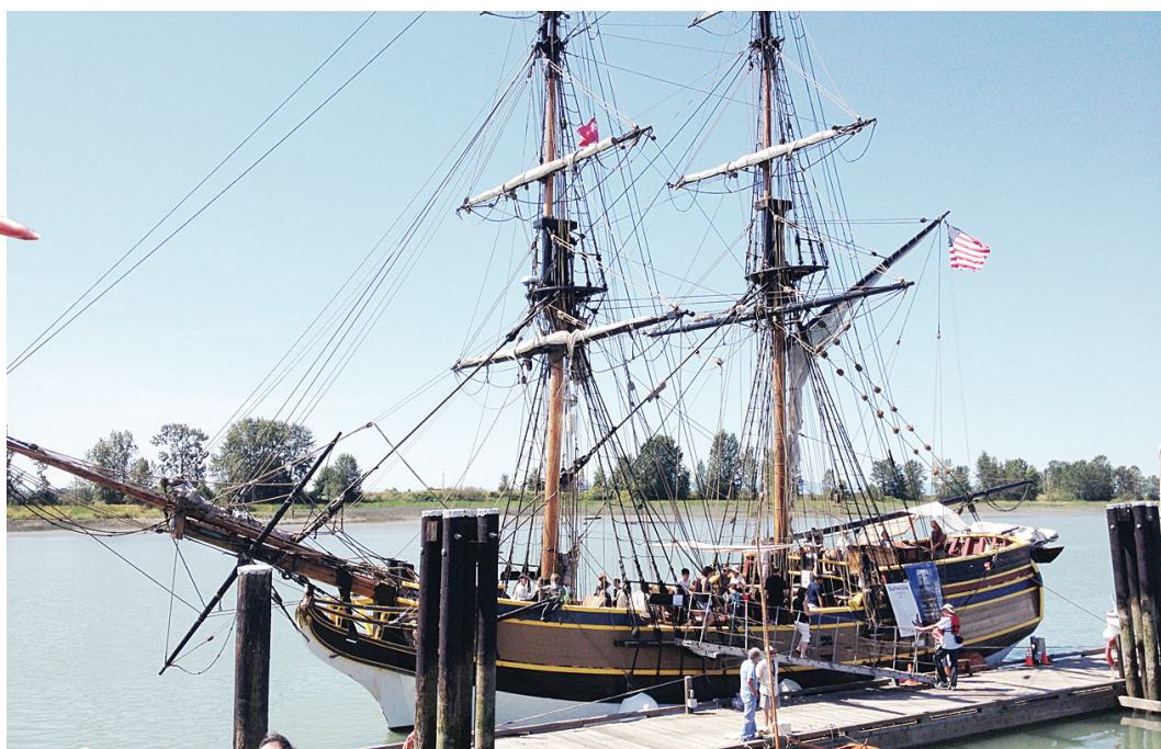
▲今年展覽的亮點是一艘名叫 Lady Washington 的高桅帆船。

張先生表示說，對原樣複製的華工寢室細節印象深刻，如麻將桌、油燈、茶具、鴉片箱等充滿中國特色的元素。他說，「看完心情很沉重，華工待遇在各國工人中墊底，每個臥鋪由木板釘成，通常上下三層，一屋擠100個華工，牀只有約寬70公分、長160公分，基本無法轉身。」