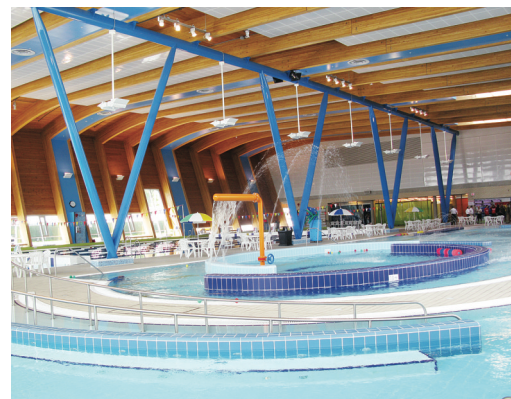
溫哥華公園局轄下游泳池，明年將加價約4%，免費入場年齡上限亦被調低至2歲。

此外，公園局亦將游泳池和冰球場入場者年齡界別更改，5歲或以下小童現被列作學前級(pre-school)可免費入場，但從明年起，這級別年齡上限為2歲，屬兒童級(Child)將包括3歲至12歲的兒童，收費由2.95元起。公園局報告指，新收費預計可為當局增加170萬元收益。