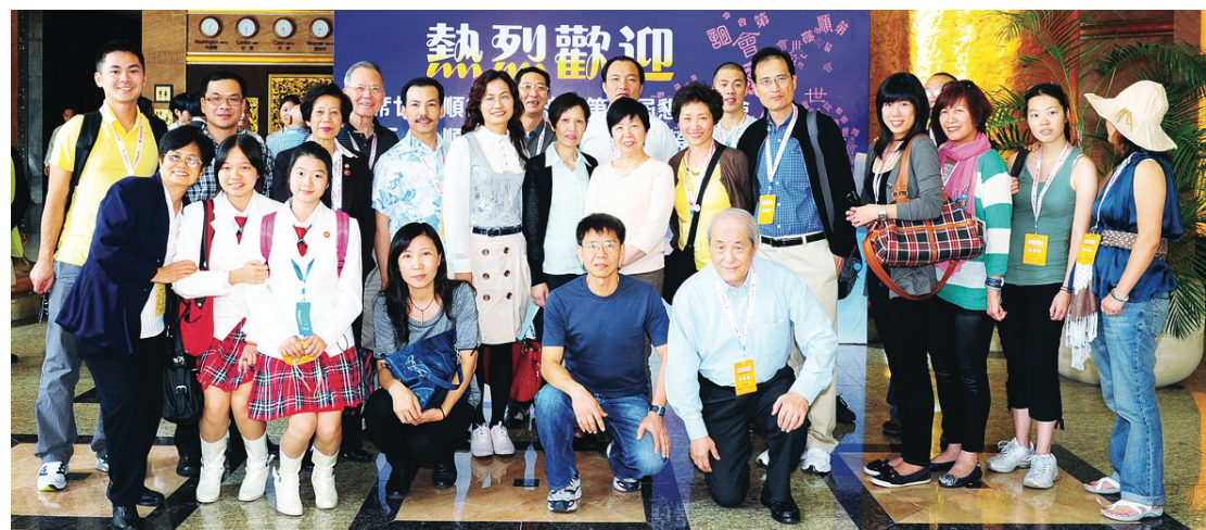
溫哥華祖籍順德人士日前飛往順德參加懇親大會。

加拿大環境部預測，威士拿地區本週四起至週六均下雪，週六最高只有零下2度，最低為零下6度，意味滑雪季節快將開始。著名滑雪場威士拿山昨日亦公布，會提前在本週五(11月19日)開放雪山供滑雪人士享用，而黑梳山將在下週四(11月25日)開放。(資料圖片)