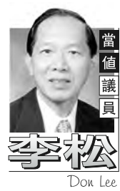
李松 Don Lee