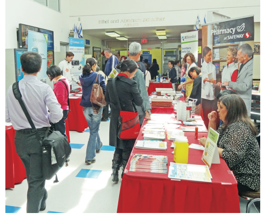
大批市民前往參觀健康攤位。

要求小朋友學習生活健康其實並不容易，帶孩子來這種場合，起碼能讓孩子知道健康是怎麼回事。她稱中僑健康一日談對英語能力較差的華人移民幫助甚大，希望以後能有更多類似的活動。