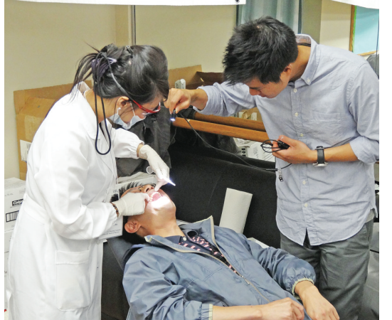
市民接受免費牙齒檢查。