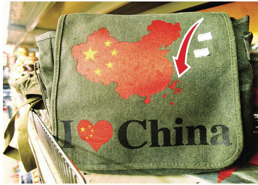
包含釣魚島（箭頭）地圖的書包在華埠熱賣。

售價18元，雖然不算貴，但也不是一般雜貨店的價錢。楊先生說，該書包看似老古董，其實也很適合現代生活，剛好裝下一個平板電腦。 楊先生也不知道這一款書包悄悄走紅，是否與最近黃岩島及釣魚島先後引起熱議有關，而有人購買這一書包也有懷舊的元素，例如住在附近大廈的一個白人青年來自俄羅斯，便特別購買這一書包，還向楊先生說了一大堆話，解釋他懷舊的原因。 不論購買的原因，但書包主人拿這一款書包出門時，肯定在宣示中國對釣魚島黃岩島等島