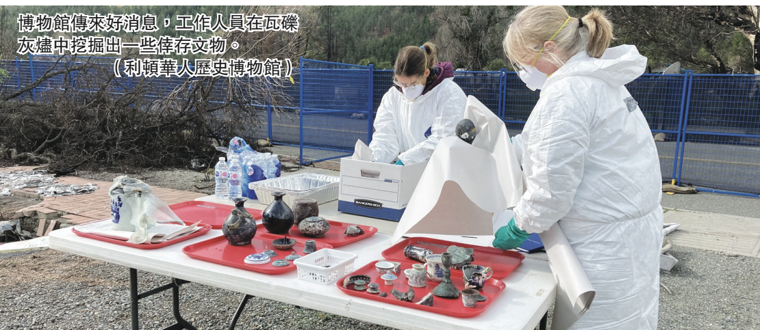
博物館傳來好消息，工作人員在瓦礫灰燼中挖掘出一些倖存文物。

【明報專訊】卑詩內陸利頓華人歷史博物館（Lytton Chinese History Museum）早前被山火焚燬，工作人員正在打掃災場，在瓦礫灰燼中挖掘到一些倖存的文物。