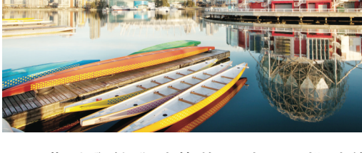
溫哥華科學館啟動籌款活動，以推動傳播「STEAM」知識。(溫哥華科學館)

【明報專訊】溫哥華科學館 (Science World) 宣布啟動一項 1000 萬元的籌款活動，以進一步將「STEAM」(科學、技術、工程、藝術/設計和數學)知識，擴展到全省和不同的社區。