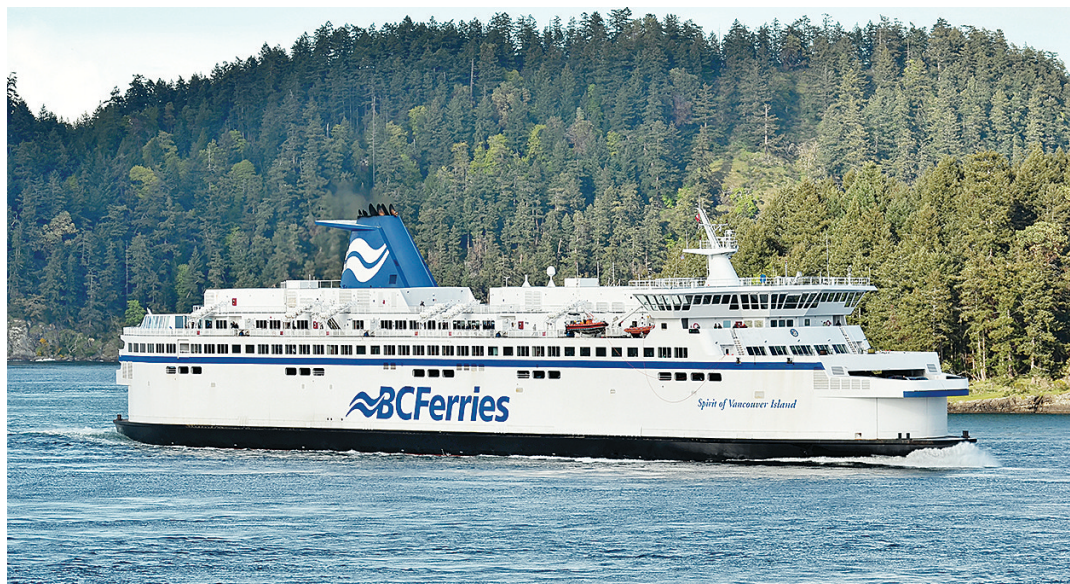
卑詩渡輪下月推出優惠，指定航班的汽車船票減至半價。

而前往哈迪港 (Port Hardy) 和海達格爾島 (Haida Gwaii) 的航線，優惠期則由11月15日開始，至12月20日結束。半價優惠只限汽車船票，車輛長度亦不能超過20呎，而司機及乘客仍要支付原來票價。