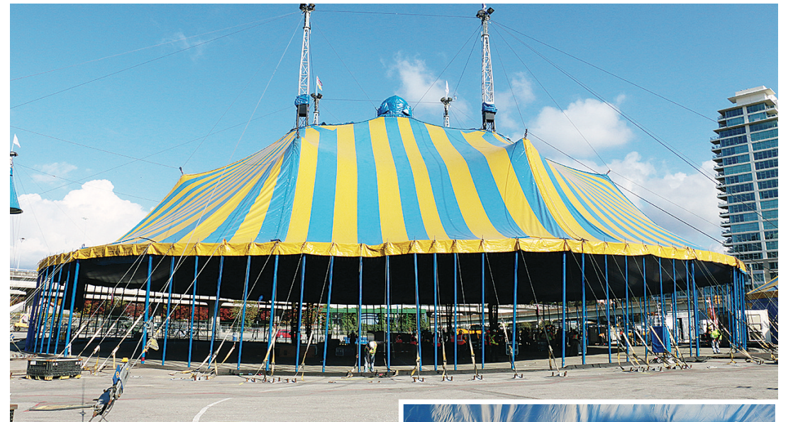
▲太陽馬戲團昨日在溫哥華協平世博廣場升起標誌性的黃藍大帳篷表演區。 ►幾十名技術人員共同協作，將100多根金屬柱子撐起。

【明報專訊】太陽馬戲團 (Cirque du Soleil) 昨日在溫哥華協平世博廣場 (Concord Pacific Place) 升起標誌性的黃藍大帳篷表演區，並將於本月29日起至12月27日為溫哥華觀眾再次獻上其經典巡迴劇目《浪迹天涯》(KOOZA)。