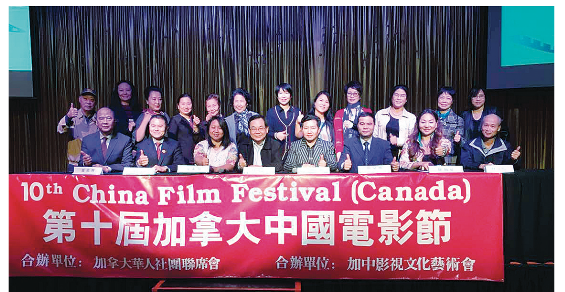
主辦方邀請民眾，前往觀看中國電影節展映的影片。(主辦方提供)

《浪迹天涯》票價自45元起，訂票請登錄太陽馬戲團官網： www.cirquedusoleil.com/kooza 或致電中文訂票熱線：1-877-850-6921。