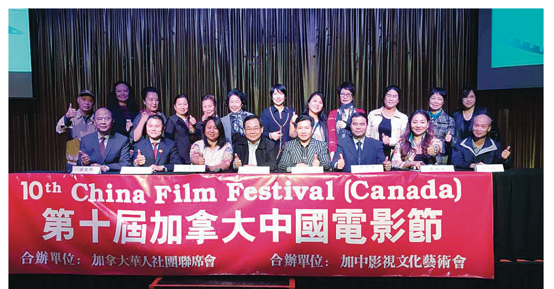
主辦方邀請民眾，前往觀看中國電影節展映的影片。

《浪迹天涯》票價自45元起，訂票請登錄太陽馬戲團官網： www.cirquedusoleil.com/kooza 或致電中文訂票熱線：1-877-850-6921。