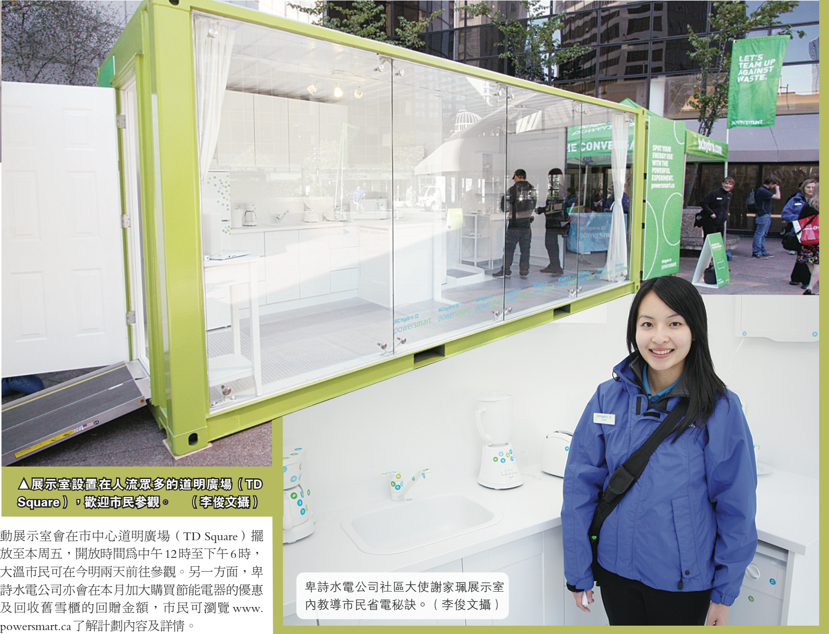
▲展示室設置在人流眾多的道明廣場 (TD Square), 歡迎市民參觀。

其中一名員工大使謝家珮表示, 他們團隊今月會於多個地方舉行不同的活動宣傳節能信息, 流