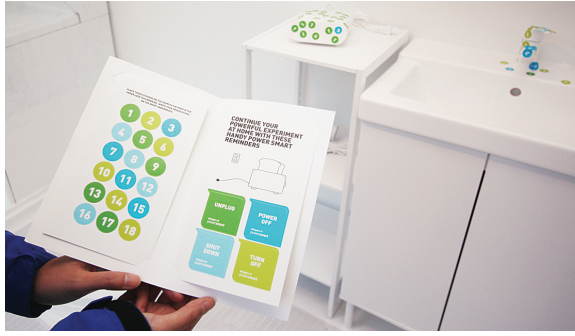
社區大使會先要市民依自己每朝起牀按序所使用的電器貼上標籤,從而了解自己的用電情況。

【明報專訊】十月份為智能省電月 (PowerSmart Month), 卑詩水電公司 (BC Hydro) 昨日在市中心設置流動展示室邀請市民參予體驗, 在卑詩水電公司社區大使的協助下, 市民會了解自己日常生活的用電情況, 並學習不同的省電竅門, 若市民完全跟從所有秘訣, 一個標準家庭每年可省掉250元電費。